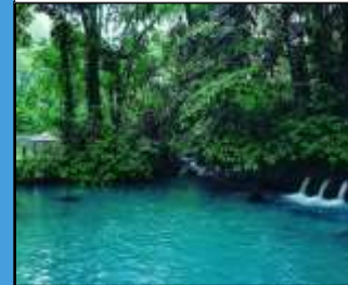
Pemandian Wisata Alam Aik Nyet dengan Sumber Mata Air Langsung