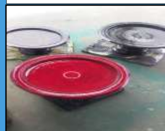
Dulang Kayu Saat Proses Pengeringan