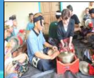
Saat Pengunjung sedang belajar Kesenian Baleganjur