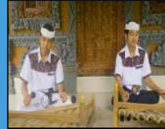
Kesenian Musik Rindik