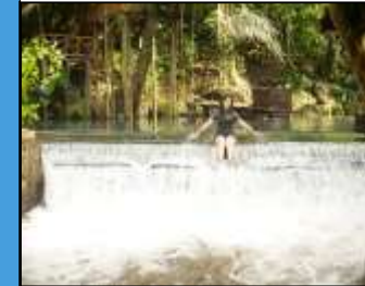
Wisata Alam Bunut Ngenggang Dengan Mata Air Langsung