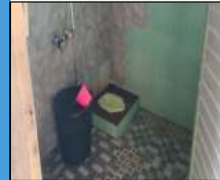
Fasilitas Toliet Umum