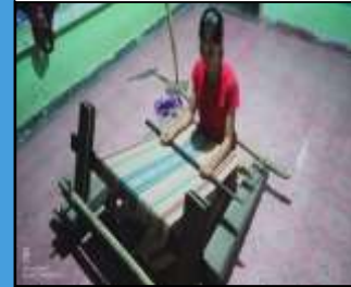
Seorang Warga Menenun Kain Songket