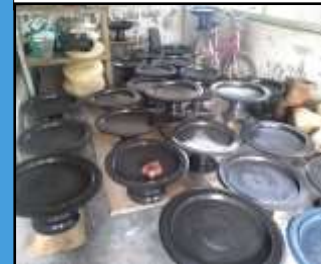
Dulang Kayu Setengah Jadi