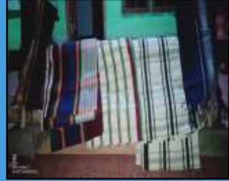
Kain Hasil Seseakan/Menenun Warga Desa Buwun Sejati