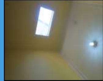
Ventilasi Udara dan Penerang Toliet Umum