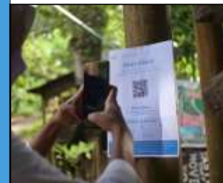
Barcode Peduli Lindungi