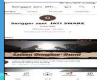
Akun Lembaga yang ada Desa