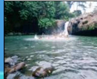
Tidak hanya hutan & sawah Desa Wisata Buwun Sejati juga memiliki Air Terjun yang memacu Agrenalin