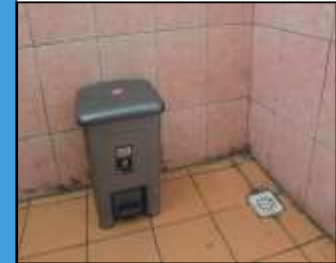
Saluran Pembuangan Toliet dan Tempat Sampah