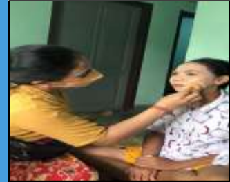
Masyarakat Setempat Sedang Merias salah satu Pengantin