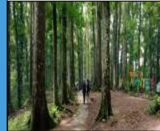
Wisata Alam Aik Nyet dengan hutan Mahoni yang berbaris Rapi