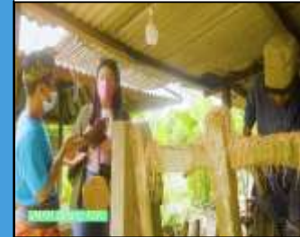
Proses Pembuatan Dulang Kayu