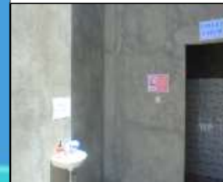
Larangan & Himbauan di Toliet Umum