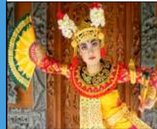
Tari Condong di Pasaraman Surya Chandra Kerti