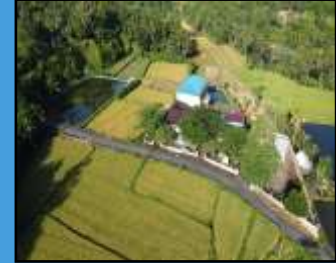
Tidak hanya hutan, Desa Wisata Buwun Sejati tersapat hamparan sawah yang luas nan indah