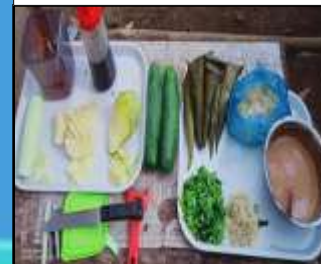
Pelecing Kangkung dan Pecel yang menjadi makanan khas Lombok