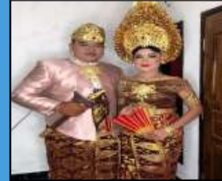
Hasil Rias Masyarakat Setempat