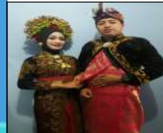
Baju Adat Khas Sasak yang dikenakan oleh Pengantin