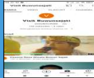
Akun Youtube Desa